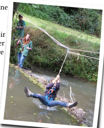
Quelques images des Passages 2015

Au plaisir de vous croiser sur notre route !