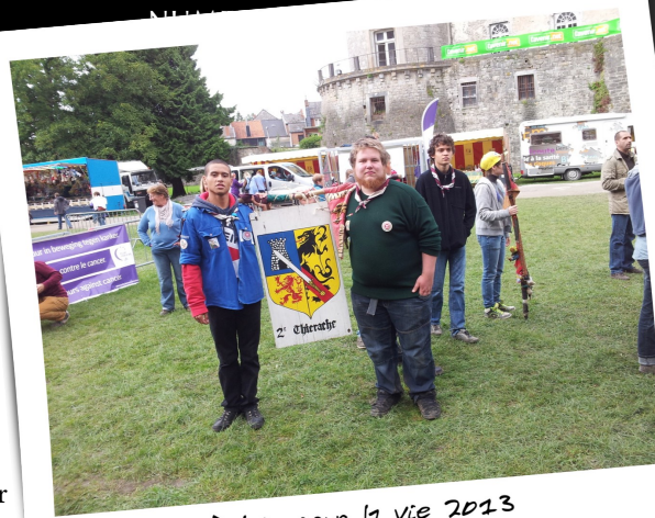
Relais pour la vie 2013

Résumons : sur le site, vous êtes tous les bienvenus pour passer du bon temps et participer à ce rassemblement de solidarité ; n'hésitez pas à passer par notre stand faire un petit coucou ☺ À 19h, nous attendons tous nos animés (des baladins aux éclaireurs aux parents) pour une veillée (en uniforme)