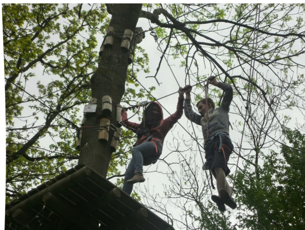
Réunion accrobranches à la troupe

Après un rassemblement, des photos souvenirs et quelques conseils précieux des chefs (on a droit à 10% de pertes mais quand même on vous aime bien alors évitez de mourir ! ;) ) nous sommes arrivés a l'entrée du parc d'accrobranches des lacs de l'eau