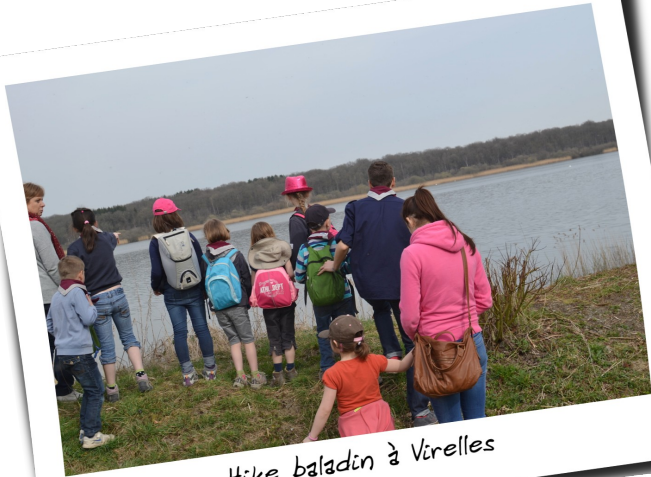
Hike baladin à Virelles