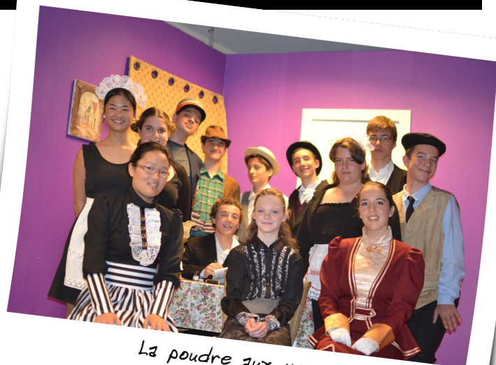
La poudre aux yeux