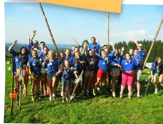
La troupe au camp 2014