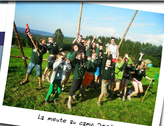
La meute au camp 2014