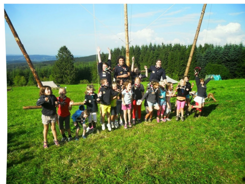
La ribambelle au camp 2014