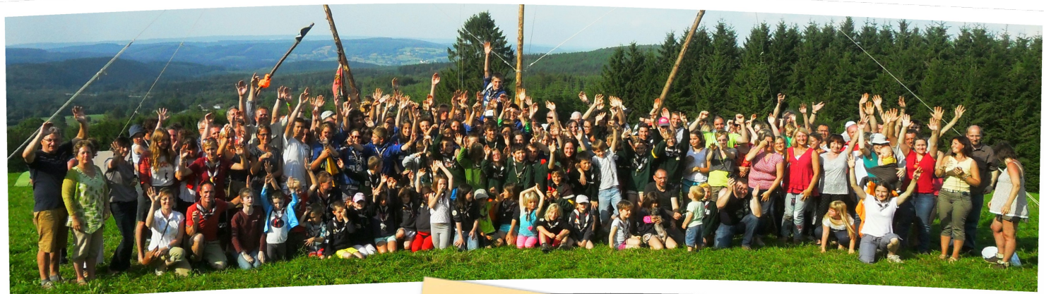
Journée des Parents au camp, 27 juillet 2014