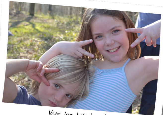
Vive les baladins !