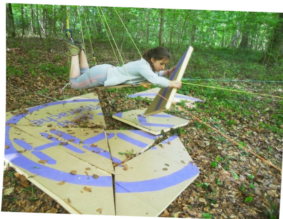
24h Thiérache à la troupe