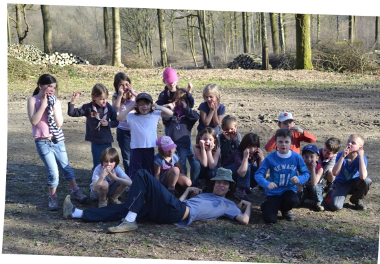
La ribambelle 2013-2014

plein de très chouettes personnes : des parents avec qui c'est toujours un plaisir de discuter après une réunion, des baladins qui courent partout dans Rosée pour voir ce qu'on leur a préparé et des chefs toujours heureux d'être là le dimanche. Cette joyeuse bande s'est donc retrouvée pour une semaine (du 24 au 31 juillet donc) pour vivre plein de belles choses.