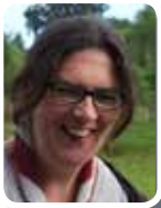
VÉTÉ AU GRAND CŒUR