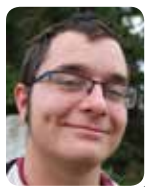
RESPONSABLE DES ANNIVERSAIRES