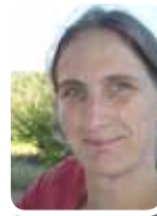
LE BAS DE LAINE