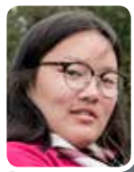
RESPONSABLE ÉCUSSENS ET TRÉSORERIE