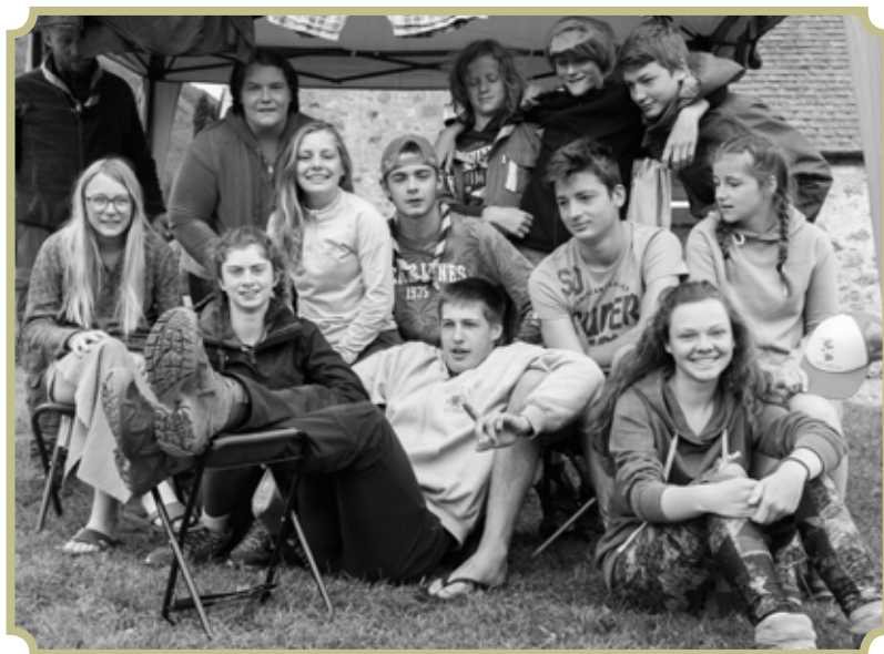
Les CP et SP

Chaque participant a payé 250 euros et le camp est revenu à 650 euros/personne. L'unité a donc payé pour chaque participant la somme de 400 euros.