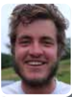
LE PETIT RAT CONTEUR À SES HEURES