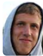
RESPONSABLE PHOTOS ET COURSES