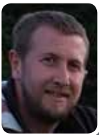
ACTION SANS BRUIT