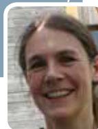
GRAPHISTE CAPTEUSE D'IMAGES