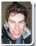
RESPONSABLE COMMUNICATION ET DÉGUISEMENT